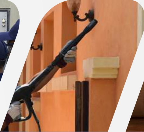
تنظيف الواجهات والنوافذ