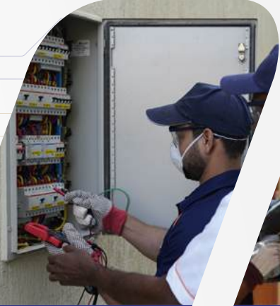
خدمات الهندسة الميكانيكية

معاونته إحدى الشركات الرائدة في تقديم خدمات الصيانة الوقائية عالية الجودة على مدار الساعة للعملاء في القطاعين السكني والتجاري "معاونته رفيقك الذي يعنى بكافة احتياجاتك للصيانة والعناية المنزلية على مدار العام"