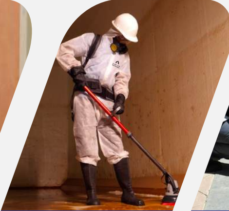
تنظيف خزانات المياه