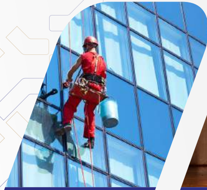
تنظيف الواجهات والطوابق العالية

تقوم معاونة بتزويد العديد من الخدمات الخفيفة لإدارة المرافق حيث يتوفر لديها مجموعة من الموظفين ذوي الخبرة لتنفيذ الاعمال المطلوبة بكل كفاءة و جودة عالية بالإضافة الى الحلول المستدامة المصممة خصيصاً لكل عميل لدينا