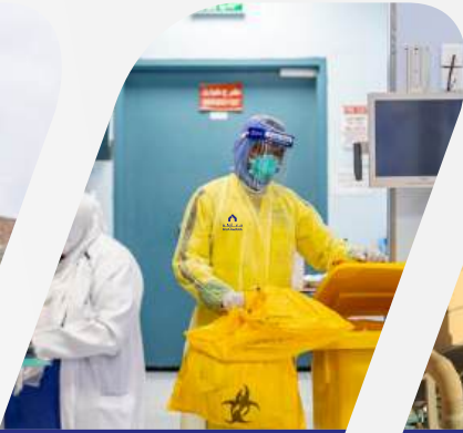
إدارة النفايات الطبية الحيوية