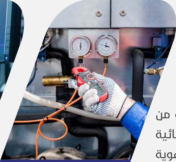
الخدمات التقنية المتخصصة