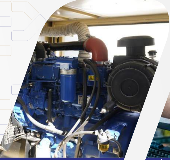
خدمات الهندسة الميكانيكية

حيث نقدم مجموعة واسعة ورائدة من الخدمات الميكانيكية والكهربائية وأعمال السباكة، والتدفئة والتهوية وتكييف الهواء، وأعمال الهندسة المدنية وخدمات البنية التحتية في الإمارات نحن نتفهم تماماً أن لكل شركة أو منشأة تحديات عدة. إن إتساع نطاق خبرتنا يضعنا في وضع فريد لتوقع مثل هذه التحديات ومعالجتها، بالإضافة إلى المقدرة على الإستفادة من نطاق تخصصنا ومعرفتنا بكافة القطاعات