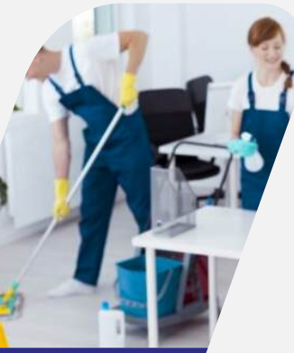
تنظيف الأماكن المغلقة