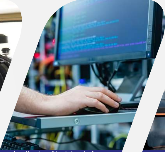
أنظمة إدارة الأصول والصيانة المساعدة بالحاسوب (CAFM)