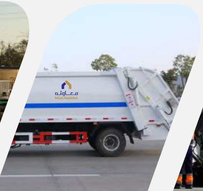
ما قبل عملية التجميع