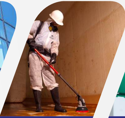
تنظيف والتعقيم خزانات المياه