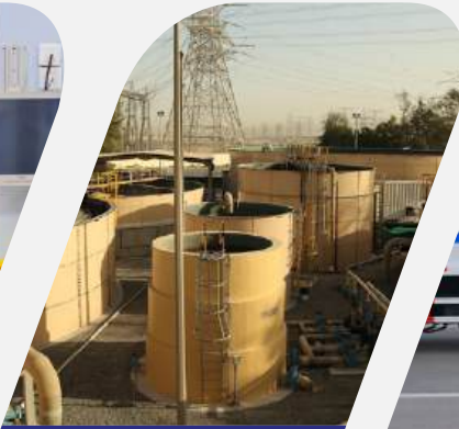
إدارة مياه الصرف الصحي