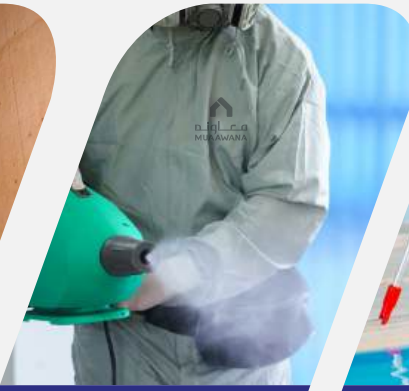
خدمات التطهير والتعقيم